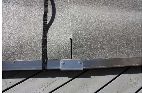
BILD 2. Skjut in flikarna mellan cellplasten och skurmattan på följande block, med det samma som du placerar blocken intill varandra. Montera skarvarna till mitt-profilen.