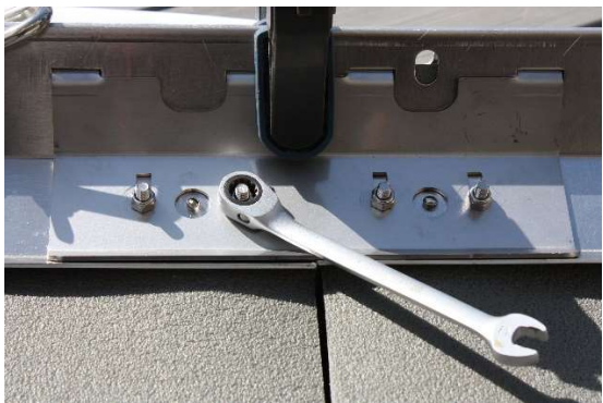
BILD 3. Placera skarven till sidoprofilen på sin plats enligt bilden och skruva lätt fast låsmuttrarna. Spänn jämt alla fyra muttrar turvis, tills dom är spända. Använd handverktyg för att dom syrefasta bultarna inte skall bli för heta och skära fast.