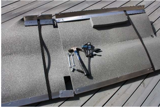
BILD 1. Börja arbetet med att placera blocken efter varandra på ett jämt underlag i ordningen, framdelen, förlängning/förlängningar och bakdelen. Hantera cellplasten varsamt.