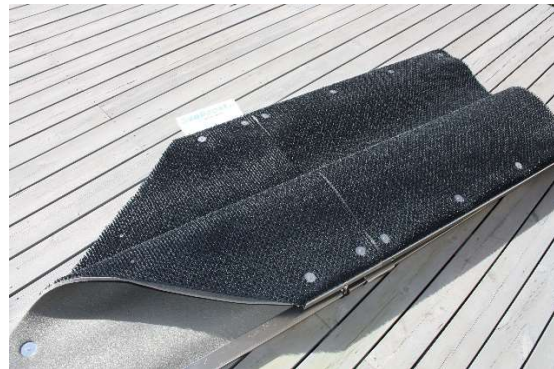
KUVA 4. Jatka kunnes päällimmäisen sivun liitospalat on asennettu, ja käännä maton reuna kuvan osoittamalla tavalla.