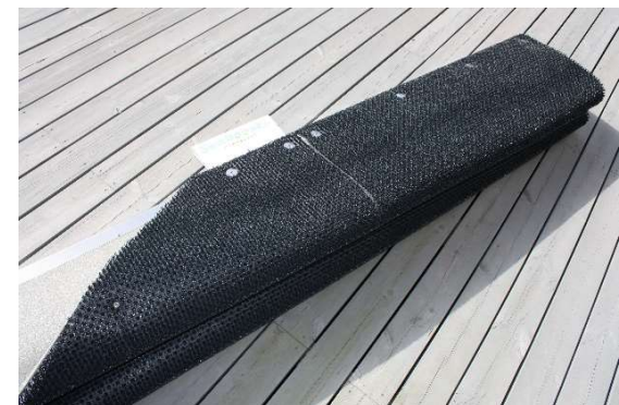
KUVA 6. Nyt Powerturf on köysien kiinnitystä vaille valmis laskettavaksi vesille. Käsittele varovasti, vältä repimistä ja kanatele mattoa tasaisesti profiileista nostojen ja laskujen yhteydessä. Suosittelemme että useampi henkilö kannattaa mattoa, eteenkin jos kokonaispituus on yli 2,4 m.