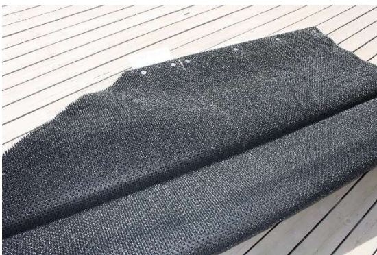
KUVA 5. Käännä tämän jälkeen ylempi puolisko kokonaan alustaa vasten ja jatka kääntämällä toisen puolen profiili päällimmäiseksi. Jatka nyt toisen reunaprofiilin liitospalojen asennusta.