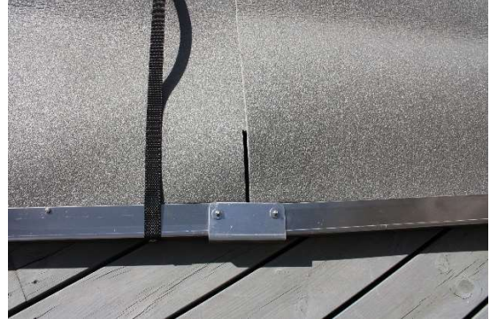
KUVA 2. Pujota lohkojen liepeet seuraavan lohkon solumuovin alle, samalla kun asettelet lohkot toisiinsa kiinni. Kiinnitä alareunan liitoskappaleet.